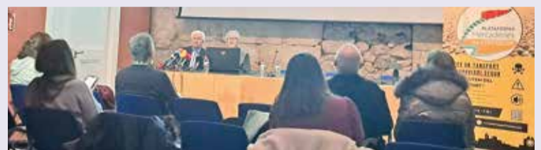
Presentació de la proposta per part de la Plataforma Mercaderies per l'Interior.

La Plataforma Mercaderies per l'Interior ha proposat un nou traçat ferroviari que transcorri en un tram en paral·lel a la Línia d'Alta Velocitat amb l'objectiu de desplaçar els trens de zones poblades. Es tracta d'un dels corredors que estudia el Ministeri de Transports, Mobilitat i Agenda Urbana com a alternativa al recorregut per la costa, una via que afecta de ple la zona de Llevant de Tarragona.