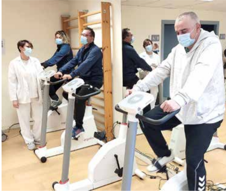
La nova unitat té com a principal missió ajudar pacients que han patit una patologia cardíaca a recuperar-se al més aviat possible.

MILLORAR LA CAPACITAT FUNCIONAL D'acord amb el cardiòleg