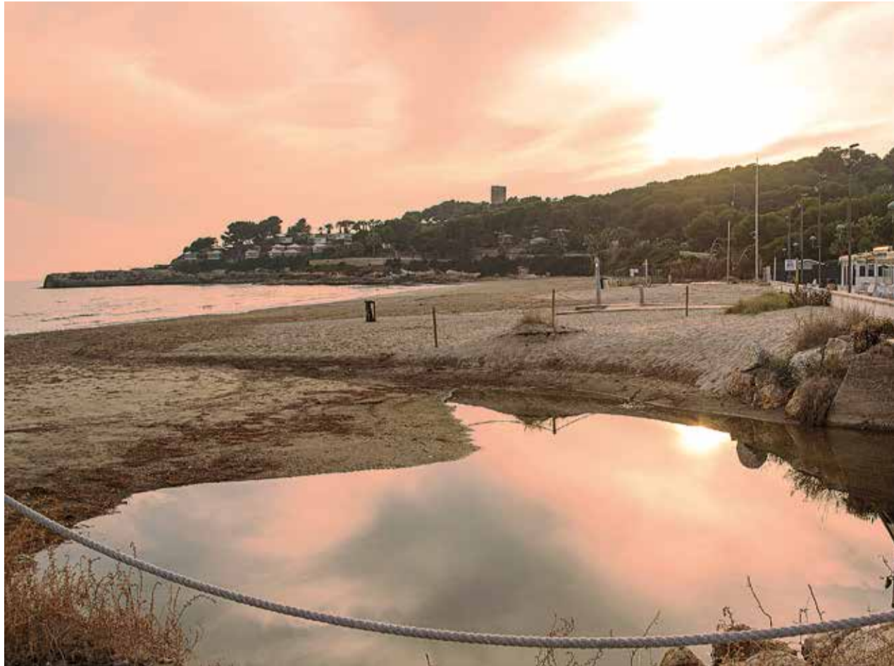
La Móra és un dels barris de platja de Tarragona, amb una gran afluència a l'estiu, però també hi viu molta gent durant tot l'any.

“La Móra teòricament és molt maca, la gent ho diu i ho és,