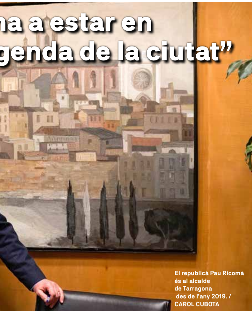
El republicà Pau Ricomà és al alcalde de Tarragona des de l'any 2019.

que fa a Llevant, un carril bici que va de la Savinosa fins a Altafulla, però que enllaçarà amb altres carrils bicicleta, alguns conseqüència dels fons Next Generation. Tarragona estarà connectada de nord a sud i de llevant a ponent amb bicicleta. Ara mateix s'està treballant en el documents. Hi ha exigències que han de ser clares, i és que totes les carreteres que ens traspassi l'Estat han d'estar en perfectes condicions. Estem en aquest punt, però amb totes les ganes i voluntat de fer aquest carril bicicleta.