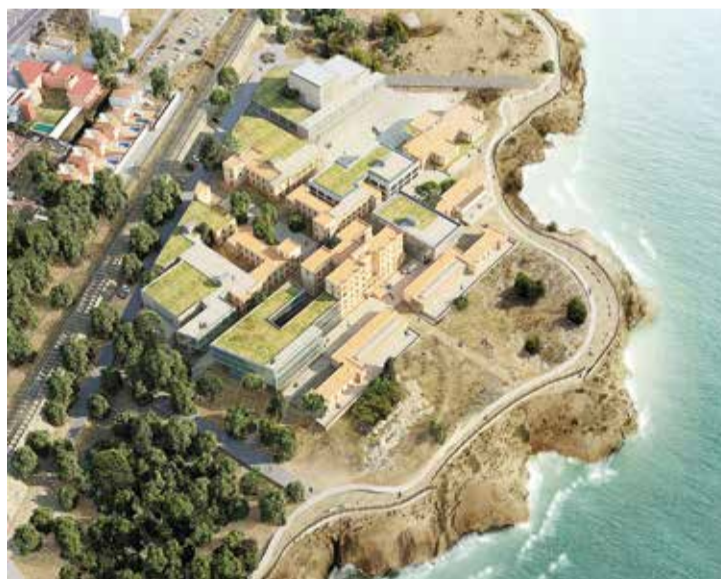
Imatge virtual de con serà la Savinosa amb aquest projecte.

En concret, al recinte s'hi ubicaran serveis que estaran permanentment oberts i d'altres amb programacions i activitats temporals. Pel que fa als primers, la Savinosa acollirà la seu de l'Escola d'Art i Disseny de la Diputació; l'Escola i Conservatori de Música de la Diputació; un centre de recursos per a la cultura i la creativitat de la demarcació; una oficina d'assessorament per a l'impuls de la creativitat i la cultura a la demarcació i un coworking per a empreses de disseny, tecnologia, cultura, educació o de l'àmbit social. També hi haurà serveis de restauració a l'aire