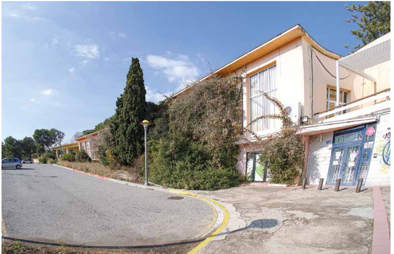
L'estat actual d'abandonament de l'equipament, situat a Boscos de Tarragona, és evident. / JOAN CASAS

No obstant això, des del primer moment el projecte va xocar amb el rebuig dels veïns de la zona de Boscos i els barris de Llevant. De fet, es va crear la Plataforma Pro Llevant, des de la qual asseguren viure amb la "por" que la Ciutat de Repòs s'acabi convertint en un centre d'acollida de menors migrants sense referents familiars (és com s'anomena actualment als MENA), de joves problemàtics, amb drogodependència, etc. "Com a veïns ens sentim desprotegits perquè s'es-